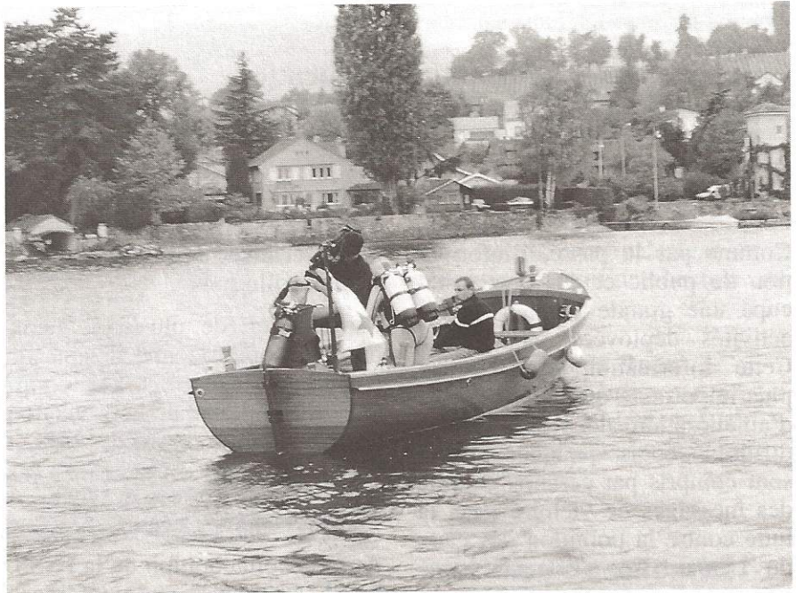
OLRP : 225 plongeurs et 70 bateaux pour prospecter les rives.

C'est ainsi qu'avec la collaboration de Jean-Marcel Dorioz, agro-