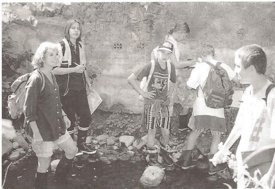
Passeports-vacances : sensibiliser les jeunes.