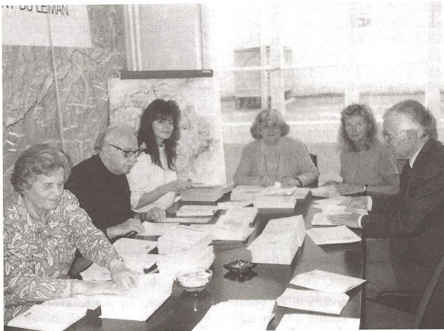
Le soutien fidèle et efficace des bénévoles.