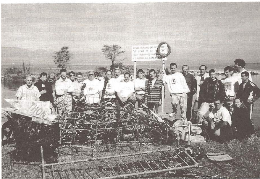
Le résultat d'une journée de nettoyage.

Une des principales conclusions de cette étude a été de confirmer la nécessité de compléter la stratégie curative de protection des eaux contre la pollution (réseaux d'assainissements, stations d'épuration) par une stratégie préventive (lutte à la source), par une meilleure gestion du territoire et une amélioration des pratiques culturales.