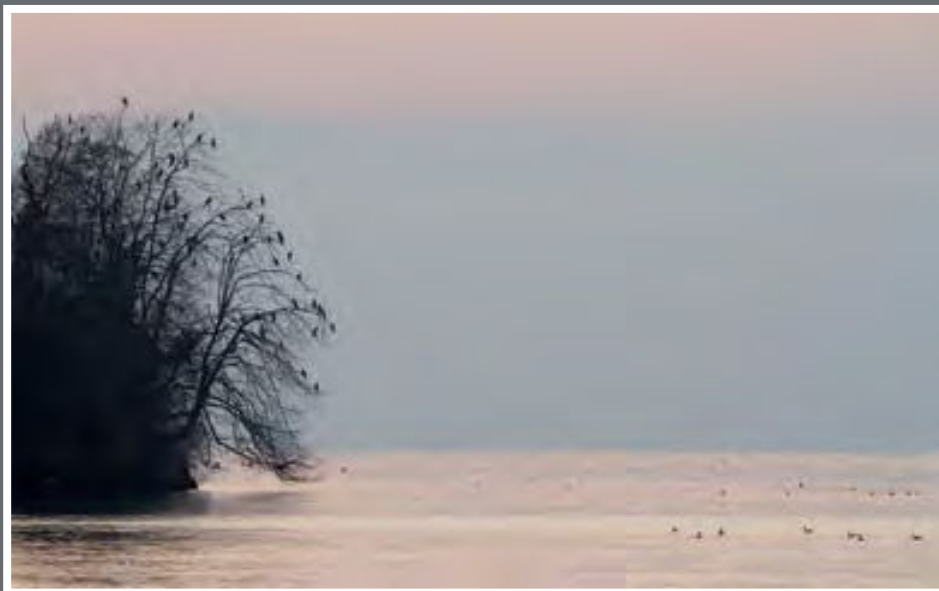
Coucher de soleil et dortoir des Grands cormorans à Meillerie.

La photographie qui évoque de bons souvenirs du lac Léman: Meillerie. Après une journée bien remplie à faire des photographies aux Grangettes, c'est là que je me suis arrêté à mon retour. Vue magnifique sur le lac avec les Grands cormorans perchés sur les arbres à la sortie du village, sans oublier le coucher de soleil.