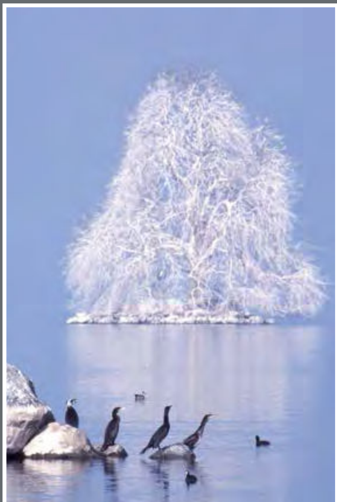
Ile de Peilz et Grands cormorans.