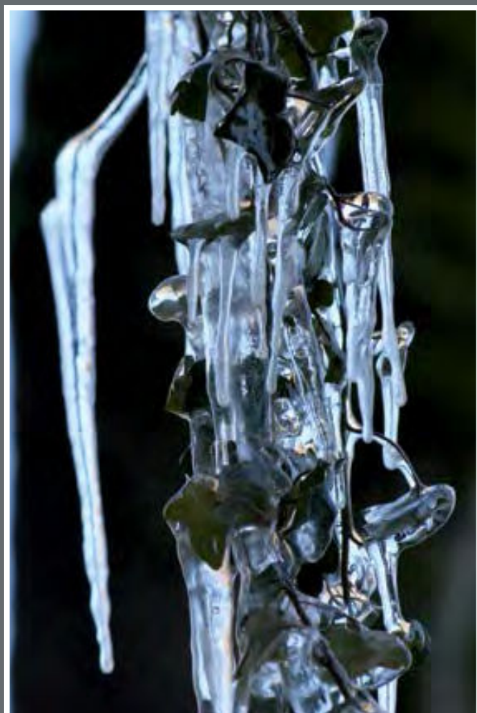
Protection de glace.

C'est en guettant la venue d'un Pygargue à queue blanche hivernant aux Grangettes que cette image magique m'est apparue.