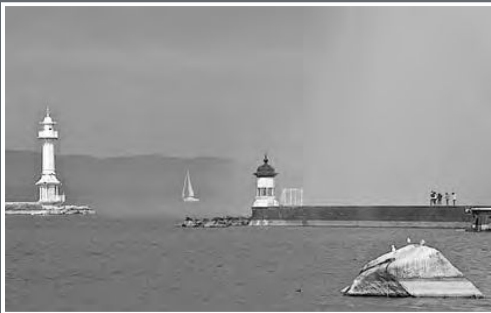
La Rade de Genève.

Le Léman fait partie de mon univers de navigateur. J'y vis des émotions et un bien-être que j'aime traduire en images, spontanément. Cette prise de vue évoque à la fois gravité et plénitude dans cette immobilité traversée par un trait de lumière éphémère, à saisir au gré d'une saison, d'un moment incertain entre jour et nuit.