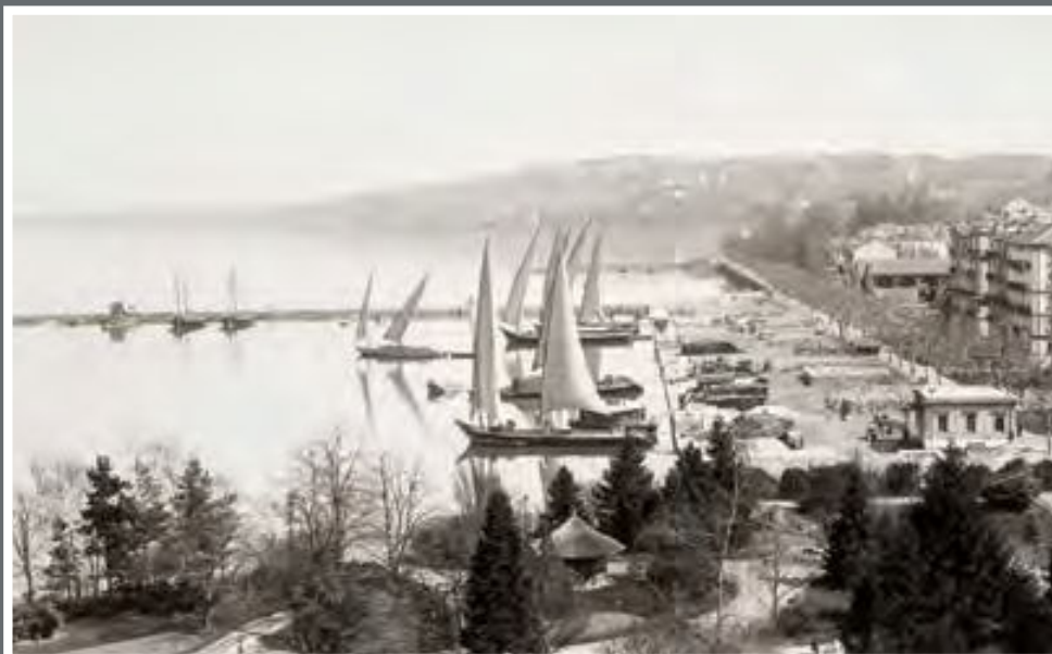
Genève, le port marchand des Eaux-Vives vers 1890.

L'activité des éditions LIGHTMOTIF, créées en 1978 par les photographes Viviane et Christophe Blatt, tourne autour de la photographie : prise de vues d'architecture, aérienne, d'illustration, édition de livres, de cartes postales et cartes de vœux de sujets lémaniques, décoration de bureaux, achat et vente de photographies historiques ( info@lightmotif.ch ).