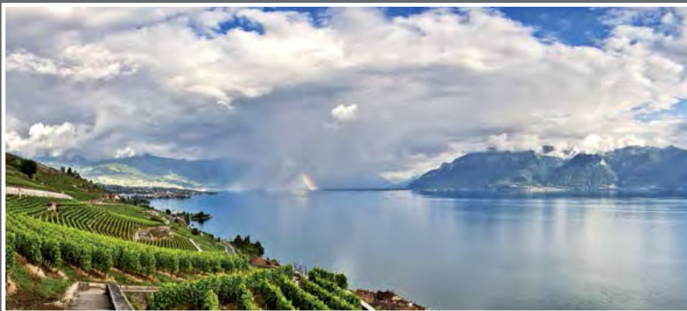
En descendant la route de la Corniche depuis Chexbres direction Vevey.

J'ai choisi cette photo du Léman car je trouve qu'elle incarne tous les contrastes que nous voyons autour du lac, nuages, arc-en-ciel (plus rare...) et toutes les nuances de couleur renforcée par la présence des nuages.