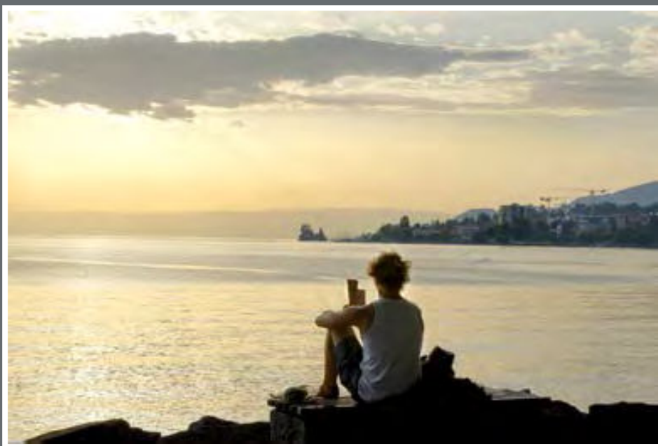
Un lecteur à Montreux.

L'eau est un élément saisissant et insaisissable, une source d'inspiration sans fin. L'eau interpelle le photographe, son aspect aux 1000 facettes renferme les clefs qui, comme les mots, ouvrent les portes de la poésie, des voyages. Les mots sécheresse et inondation, font oublier ceux de pollution et gaspillage. Les archives jjkphoto.ch , ce sont plus de 30 000 clichés de notre société disponibles pour la presse, les particuliers et les associations ou juste pour le plaisir.