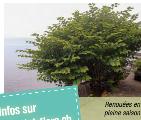
Renouées en pleine saison

Infos sur www.infoflora.ch et sur les sites officiels des cantons.