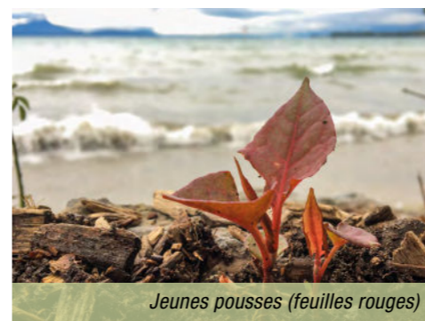
Jeunes pousses (feuilles rouges)